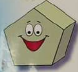
Шеңбер Трапеция Бесбұрыш